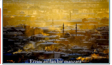
Erzincan'dan bir manzara