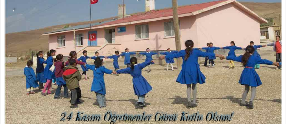
24 Kasım Öğretmenler Günü Kutlu Olsun!